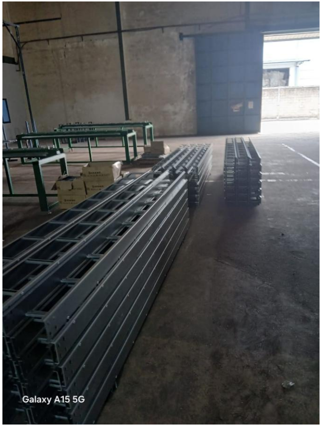
Galaxy A15 5G