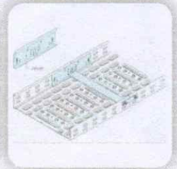
HI TEC TRAY