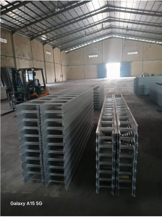
Galaxy A15 5G